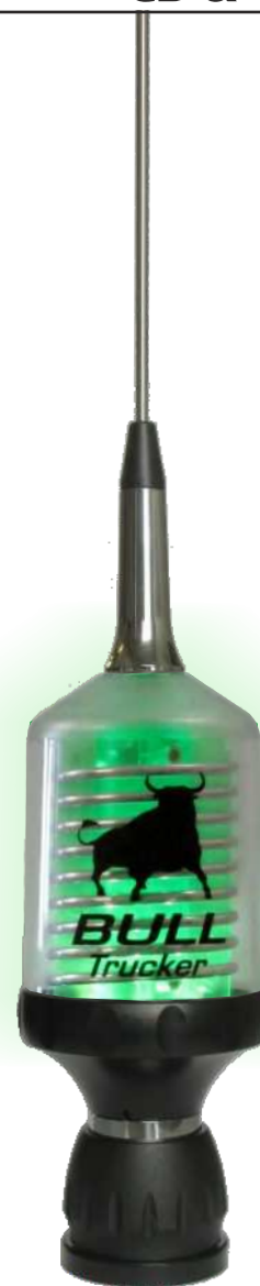
3500 or 5000 Watts Low Loss Coil